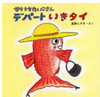
『デパートいきタイ』 長野ヒデ子/童心社

絵本の面白さ、楽しさを伝え、子どもが本好きになるよう、大人と子どもと一緒に楽しめる絵本の原画展と講演会を開催します。