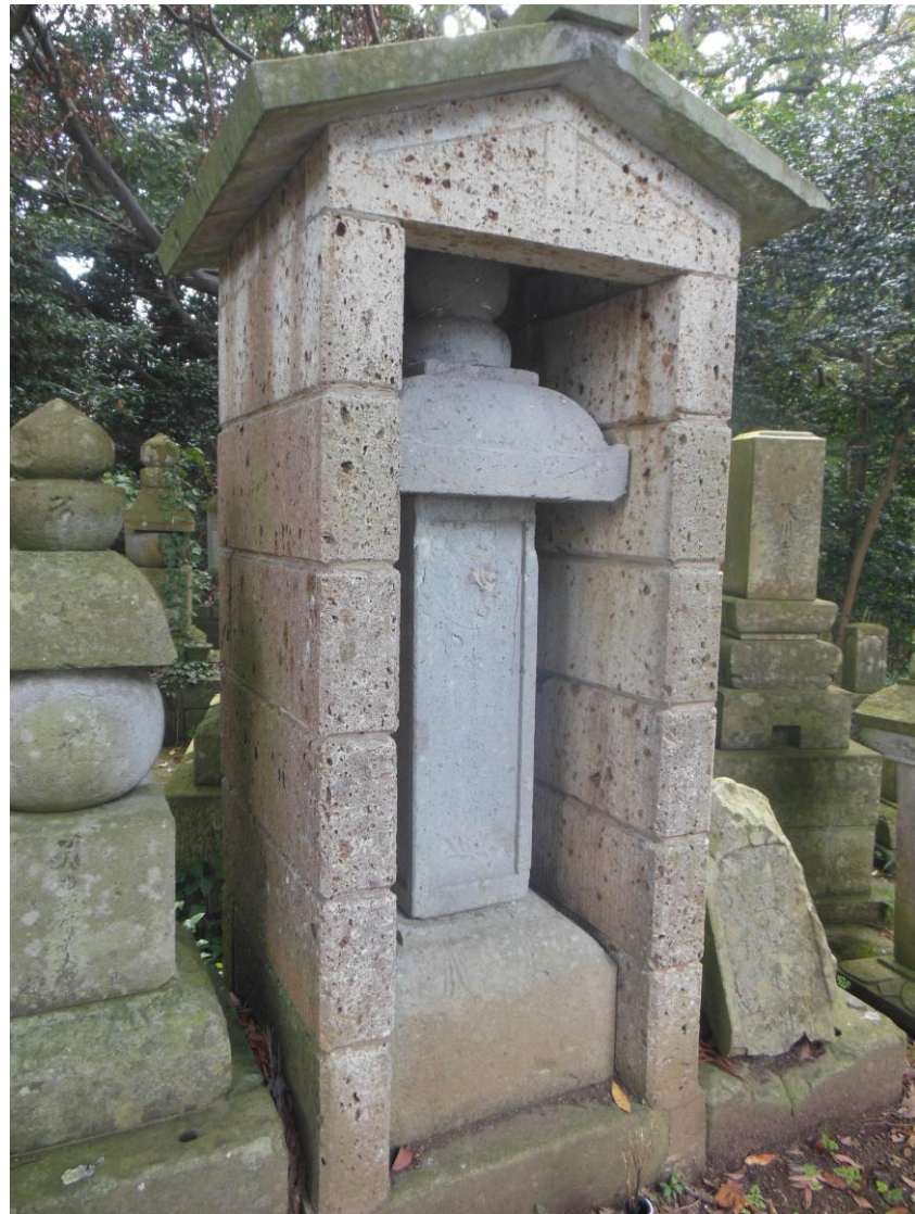
「韃靼漂流者供養碑」