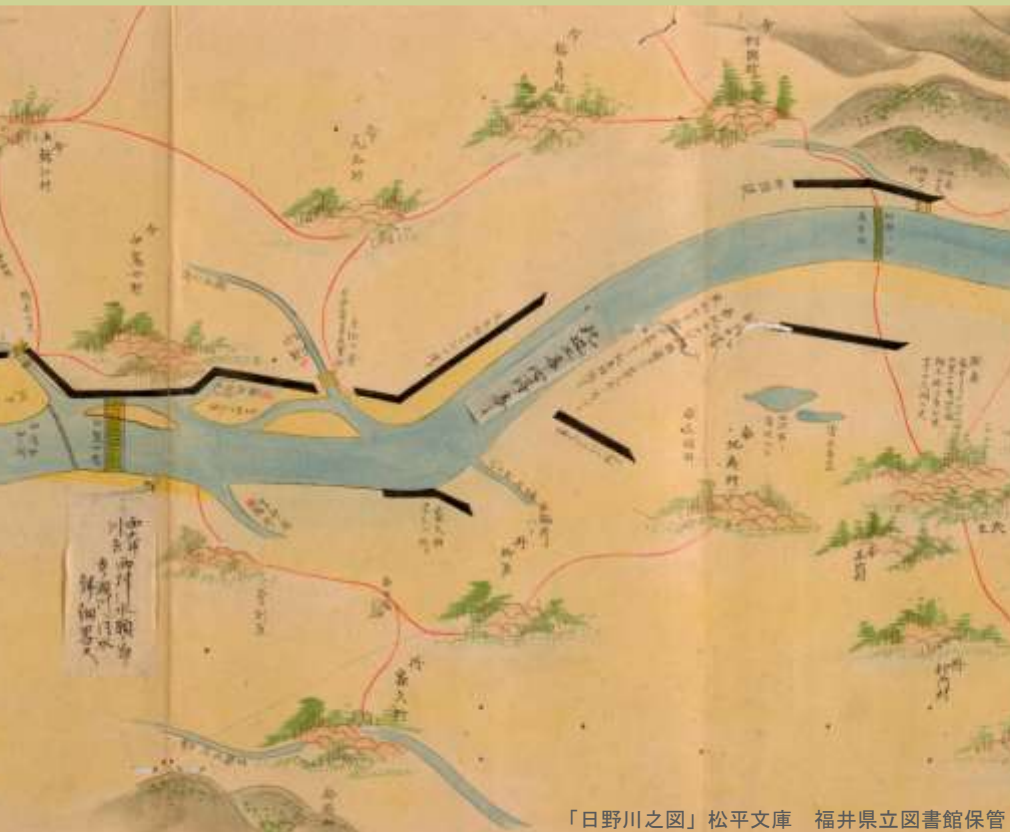
「日野川之図」松平文庫 福井県立図書館保管