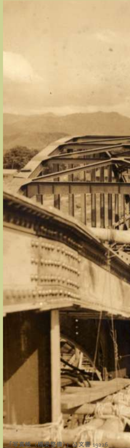
「写真帳 (橋架整備)」 公文書 19226