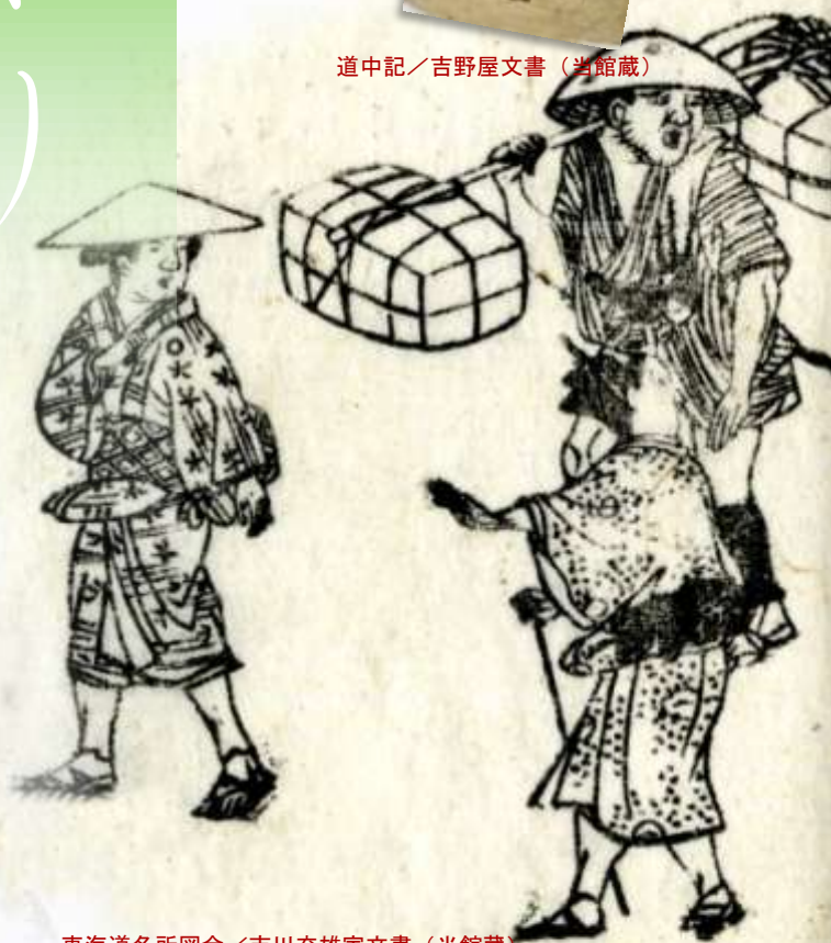
東海道名所図会／吉川充雄家文書（当館蔵）