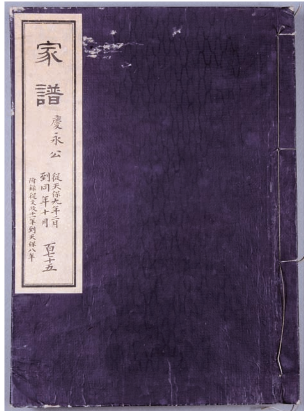
越葵文庫 福井市立郷土歴史博物館保管