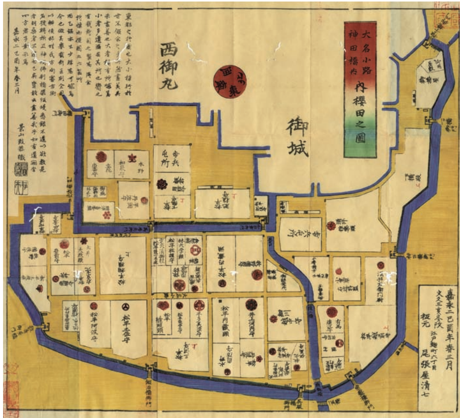
3 「大名小路神田橋内内桜田之図」(文久3年) 図の右下に「松平越前守」とあるのが福井藩の常盤橋上屋敷である。