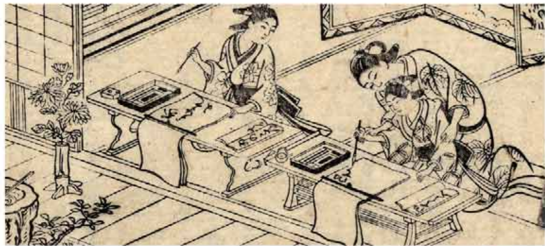
● 貝原益軒『女大学宝箱』1716年 桜井市兵衛家文書 福井県文書館蔵