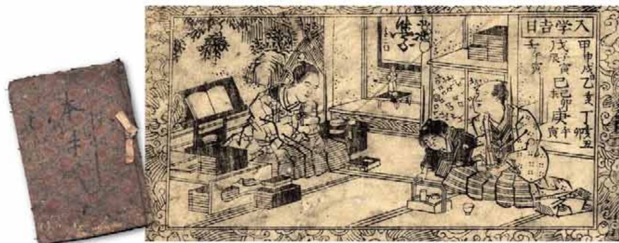
● 九日庵素英『万宝古状揃大全』1845年 福井県立歴史博物館蔵