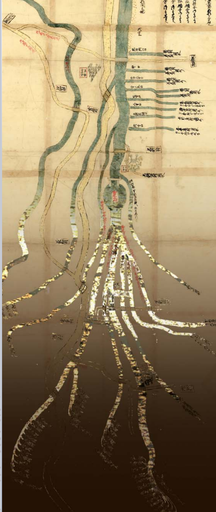
福井県文書館 閲覧室展示 2005 Annual Renewal