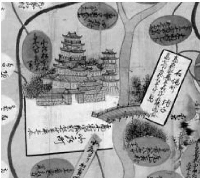
スライド2 慶長国絵図部分(福井城下周辺)

この絵図(スライド1)は慶長10年(1605)頃のものとして推定されている越前一国を描いた図です。ちょっと見ただけでははっきりしませんが、福井県史の資料編の中に「絵図・地図」編(資料編16上)という編がありまして、その中に入っているものとほぼ同じものです。県史の図は随分うまく印刷されていますので、文字も十分に読めます。今日はその個々の文字を問題にするつもりはありませんので、だいたいどういうものかということをおの人にわかっていただければよいと思います。場所から言いますと、画面一番下の隅にあるのは敦賀郡です。北の方の真ん中のところに、ちょっとぼやけていますが、お城のあるところが足羽郡ということになります。全体で色がいくつかに分かれていますが、これが1つの郡を表しています。それぞれの郡に、村の名前と