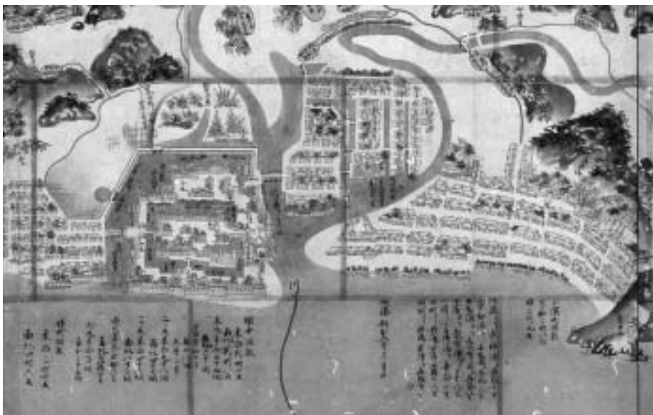
スライド4 若狭国絵図部分(小浜城周辺)

若狭の方もついでに見ておきたいと思います。この図(スライド3)は正保2年(1645)、慶長期からは少し遅れ、17世紀の半ばに作成されたものです。この絵図は現在全国に残っている国絵図の中でも少し特異なものです。国絵図というと当然1つの国を描いたものですが、この絵図はどういうわけか、越前の敦賀郡と一緒に描かれています。ここの部分がその敦賀郡です。そして、ここが三方・遠敷・大飯というふうに若狭3郡が描かれています。この少し特徴のある図ですが、ほぼ1寸を1里という縮尺で描いています。しかし、現在の地図のように厳密に1寸1里で描かれているわけではなく、だいたいそのぐらいで描かれていると考えてください。実物は、いま映っている画面の倍ぐらいの大きさがあります。先程の越前の国絵図も相当大きい。この図よりもふたまわりぐらい大きな図です。