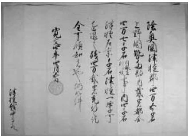
スライド6 寛文4年(1664)の津軽信政宛の徳川家綱領知朱印状 (国文学研究資料館史料館所蔵)

の紙で、扱いも悪いといえは悪い。ですが1つの権威の象徴のようなものです。最初に「筑後国山門郡五万七千三百七拾壺石五斗」というように、まず筑後国の国名が書かれておりまして、その次に郡名が書かれ、そしてその次に高(その郡の中の高)が書いてあります。少し細かな話になりますが、原則を申しますと、「山門郡五万七千三百七拾壺石五斗」と書いてある場合は、これは山門郡全体が柳川氏に宛行われたということを示しています。そうでない場合はどう書いてあるかといいますと、その次のところに「三池郡之内」というように「之内」という言葉が入っていますが、この場合は「三池郡の一部ですよ」ということを示しています。だから三池郡の内2万7518石5斗余ということになります。そして、このように筑後国の郡々の名前がそこに書かれておりまして、一番最後に「都合拾万九千六百四拾七石余[目録在別紙]事、如前々全可令領知之状、如件」とあります。以前からの領知を認めたのがこの領知判物というものです。