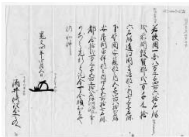
スライド7 寛文4年の小浜藩2代酒井忠直宛の徳川家綱領知判物写

次にこうした領知判物や領知朱印状について、今、私は2つの事例を示しましたけれども、一般的には、例えば将軍が大名に領知を宛行った時に将軍から大名に与えられるものだというように考えるのがごく常識的だと思いますが、実は江戸幕府についてはそうではありません。実際に知行を宛行った時には、必ずしも領知宛行状は出されていない。では、いつ出されるのかということが次に問題になります。そのことを説明するためにもう少し見ておきたいことがあります。福井県の事例を先に2つ紹介したいと思います。