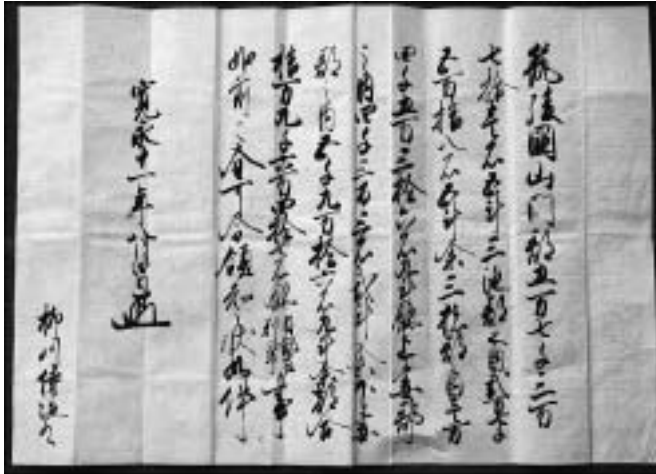
スライド5 寛永11年(1634)の立花宗茂宛の徳川家光領知判物 (「立花文庫」御花史料館蔵 柳川古文書館保管)

これ(スライド5)は、古文書学上は、領知判物というように名付けられているものです。判物というのは、このように据えられた花押があるものをいいます。これは3代將軍徳川家光の花押です。だから3代將軍家光が、宛名に「柳川侍從殿(筑後柳川の大名家立花宗茂)」と書いてありますが、彼に与えた領知判物ということになります。大きさはだいたい、縦が45センチぐらい、横が60センチぐらいで、大高檀紙という紙に書かれたものです。たいへん大きい大型