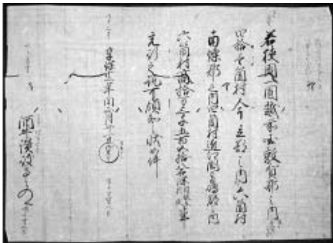
スライド9 享保12年(1727)酒井忠音宛の徳川吉宗領知朱印状 (「酒井家文庫」小浜市立図書館所蔵)

次に3番目のところに入ります。今まで私は、江戸時代の将軍が大名に出す領知朱印状あるいは領