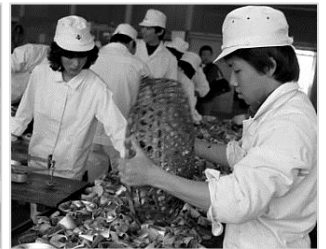
▲小浜水産実習(缶詰)昭和56年 68448