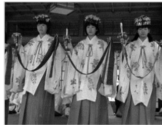
▲宇波西神社春祭り