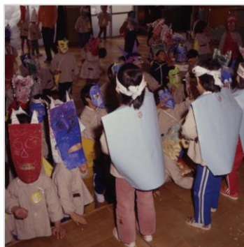
▲節分豆まき(さくらんぼ保育園) 昭和56年 70656