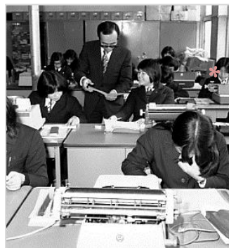
▲福井商業高校 昭和49年 67125