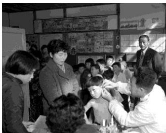
▲新入学児の健康診断(春山小学校) 昭和35年 60926