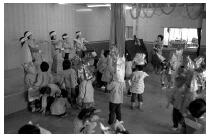
▲節分(さくらんぼ保育園) 昭和56年 68241