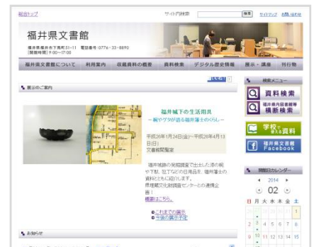
▲文書館トップページ