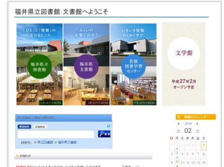
▲3館共通トップページ

(2) 文書館と県立図書館で別々に申請・登録していた利用カードを共通化しました。