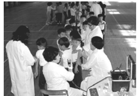
インフルエンザ予防注射(昭和44年)