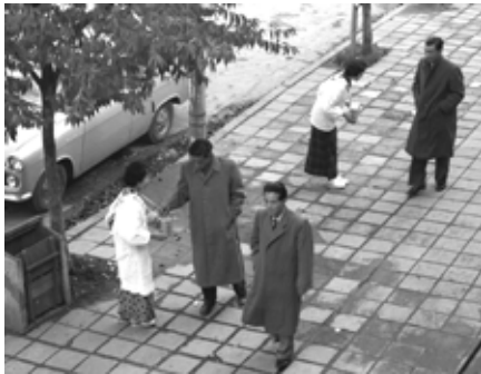
歳末たすけあい(昭和35年)