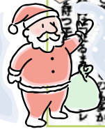
昭和8年12月26日付大阪朝日新聞

年末年始の挨拶に贈り物をする時期がきた。県外に送られる贈答品は名産「越前がに」が最も多く、今のところ昨年の約2倍の量を福井駅で取り扱った、という記事だよ。福井駅では年末の時期は小荷物の取扱時間をのばしたり、駅裏口でも取り扱ったりして対応していたそうだよ。