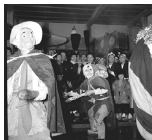
睦月神事(清水町) 昭和34年 60371