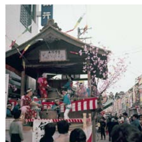
左義長(勝山市) 昭和46年 60105