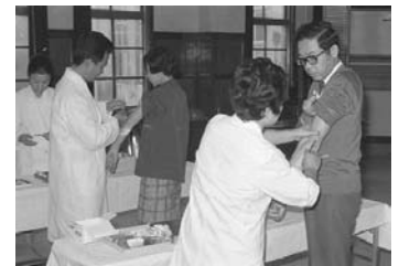
左: センバイ焼き 昭和55年 68073