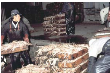
越前かに 昭和45年 60026