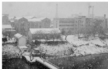
雪の降る町(福井市) 昭和46年 65566