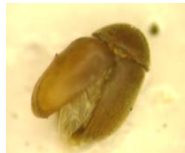
タバコシバンムシ (成虫の体長2～3mm)