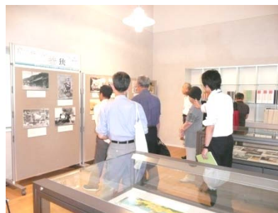
講座の後の展示説明のようす