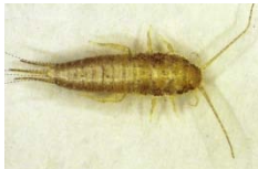
ヤマトシミ (成虫の体長8mm以上)