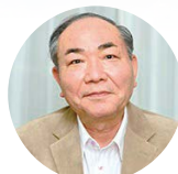
特別審査委員長 出久根 達郎

1928年福井市に生まれる。 1965年『玩具』で芥川賞、1990年『流星雨』で女流文学賞、1998年『智恵子飛ぶ』で芸術選奨文部大臣賞、2003年恩賜賞・日本藝術院賞、2011年『異郷』で川端康成文学賞、『紅梅』で菊池寛賞を受賞。現在、日本藝術院会員。主な小説に『炎の舞い』『絹扇』、エッセイに『風花の街から』『明日への一歩』ほか多数。