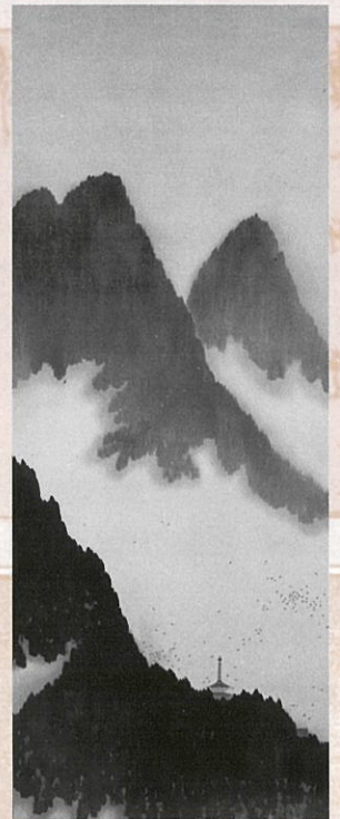
横山大観「群鴉」 (福井県立美術館蔵) (展示期間：1月20日～2月21日)