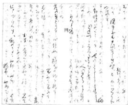
樋口一葉「たけくらべ」草稿 (日本近代文学館蔵)

本展では、近代文学を切り口に、文明開化の激流の中、新しい文化を切り拓いていった明治時代を振り返ります。